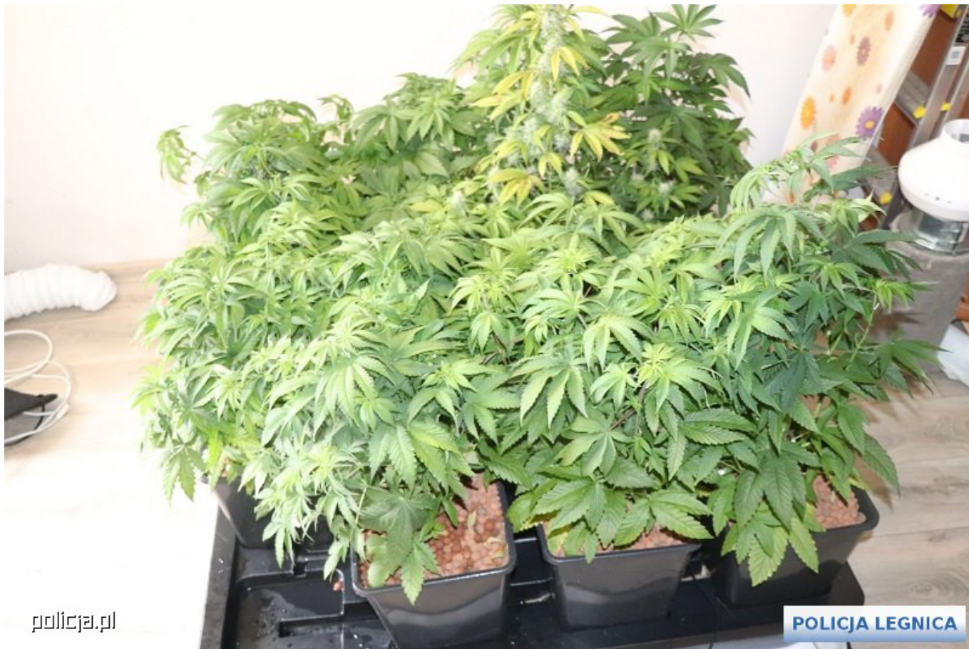
Zatrzymana przez policjantów z Dolnego Śląska marihuana, 2020 r.

Autorzy raportu podkreślili przypadki odnotowywane we Francji, Włoszech, Hiszpanii oraz Zjednoczonym Królestwie. Istotne w tym zakresie jest wskazanie na hipotezę odnoszącą się do prawdopodobieństwa wzrostu prób użytkowania nowych technologii do przemytu narkotyków do zakładów karnych. Wskazuje się w głównej mierze na wykorzystywanie bezałogowych statków powietrznych (BSP), czyli popularnych dronów. Trzeba dodać, do głównego nurtu rozważań na bazie raportu, że ewidentnie nadszedł moment, w którym służby więzienne będą musiały szybko inwestować środki finansowe w systemy antydronowe.