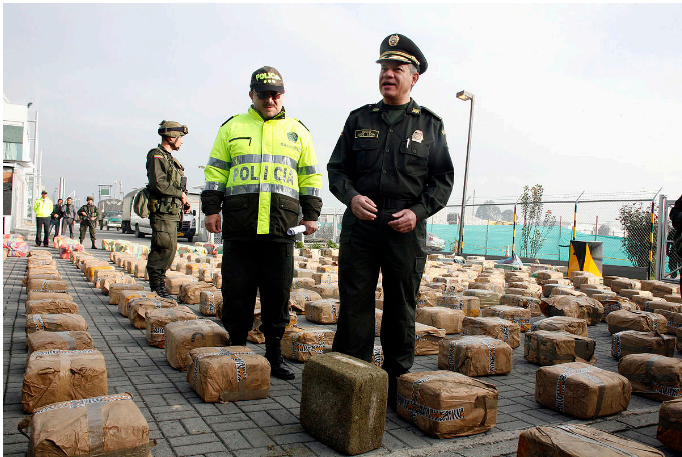
Kolumbijska policja przechwytuje kokainę.

Zauważalne dla przeciętnego obywatela ograniczenia, w zakresie poruszania się na kontynencie, pomiędzy państwami UE oraz poza nimi, nie przełożyły się generalnie na możliwości grup przestępczych w zakresie obrotu narkotyków. Oczywiście pandemia koronawirusa uderzyła w pomniejsze formy, np. szmuglowania mniejszych ilości środków odurzających, chociażby za pomocą lotów komercyjnych czy też przejazdów prywatnych pojazdów. Jednak, należy pamiętać, że cały czas utrzymywana była spedycja, w tym na szlakach morskich. Dotyczy to również transportu dóbr pomiędzy państwami wewnątrz UE.