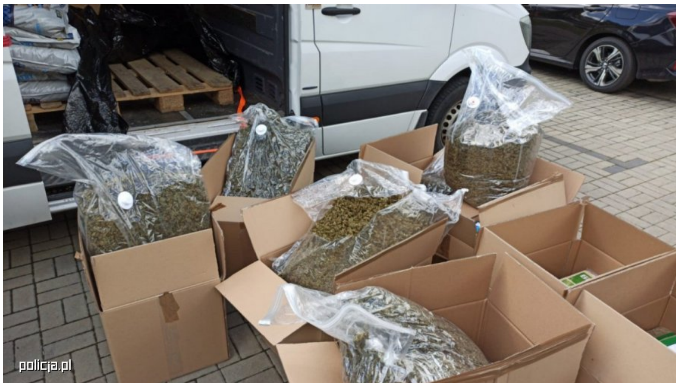
Narkotyki zatrzymane przez polskich policjantów po przekroczeniu granicy z Czechami, 2020 r.

Przestępcy znacząco ograniczają w ten sposób np. możliwość przyłapania ich przy przekazywaniu narkotyków, bowiem transakcje są "dogadywane" np. poprzez szyfrowane komunikatory, a opłata następuje za pomocą kryptowalut. Ostatecznie odbiór narkotyków odbywa się z zastosowaniem swoistych martwych skrzynek, gdzie w specjalnym kontenerze ukrywane są narkotyki. Należy podkreślić, że współcześnie narkobiznes nie tylko zatruwa w rzeczywistym świecie życie ludzi, ale również w coraz większym stopniu wkracza do domeny cyber. Tym samym, stwarzając całkiem nowe potrzeby w zakresie inwestycji w technologię, która jest lub powinna być na wyposażeniu służb antynarkotykowych w poszczególnych państwach UE.