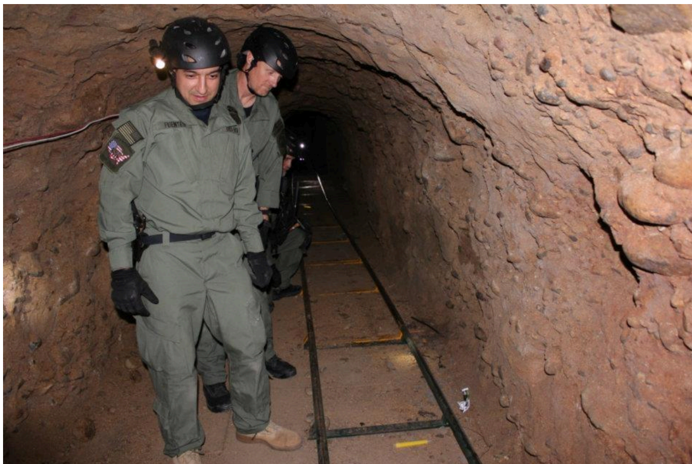
Fot. DHS, domena publiczna